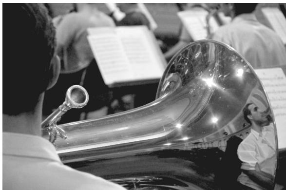
(Orquestra da UFRJ)

I. Oh, deusa da sabedoria! Tu és a minha inspiração! Nesta jornada, a estrela-guia, E deste hino, a emoção. Sou UFRJ! A educação é a minha rota. Sem temor ou preconceito, Abro o coração ao mundo inteiro!