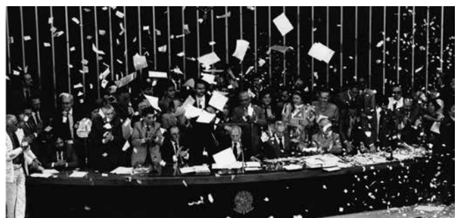
Congresso Nacional. Assembléia Nacional Constituinte. Promulgação da Constituição. 5 de outubro de 1988.

Em outubro de 2013, foram celebrados os 25 anos de promulgação da Constituição Federal. Aprovada um ano e sete meses depois de convocada a Assembléia Nacional Constituinte que a elaborou, a nova Carta Magna, ainda que com suas limitações, é um marco histórico das lutas pelo fim da ditadura imposta ao país durante 21 anos pelo golpe civil-militar de 1964. A democratização ampla e profunda da sociedade e do Estado, a consolidação e o alargamento dos direitos de cidadania seguem como desafio para a ação continuada de todos os brasileiros comprometidos com as lutas democráticas.