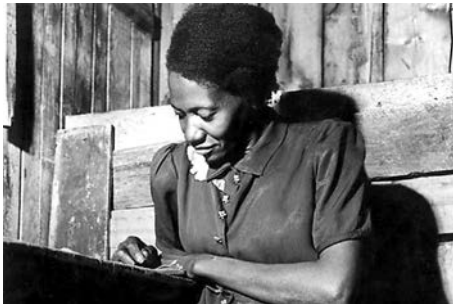
Carolina Maria de Jesus

[...] em 1948, quando começaram a demolir as casas térreas para construir os edifícios, nós, os pobres que residíamos nas habitações coletivas, fomos despejados e ficamos residindo debaixo das pontes. É por isso que eu denomino que a favela é o quarto de despejo de uma cidade. Nós, os pobres, somos os trastes velhos. [...] “[...] Eu classifico São Paulo assim: o Palácio é a sala de visita, a Prefeitura é a sala de jantar e a cidade é o seu jardim. A favela é o quintal onde jogam os lixos. [...]” “Quando estou na cidade, tenho a impressão que estou na sala de visita, com seus lustres de cristais, seus tapetes de veludo, almofadas de cetim. E quando estou na favela, tenho a impressão que sou um objeto fora de uso, digno de estar num quarto de despejo.” “[...] nós somos pobres, viemos para as margens do rio. As margens do rio são os lugares do lixo e dos marginais. Gente da favela é considerada marginal. Não mais se vê os corvos voando às margens dos rios, perto dos lixos. Os homens desempregados substituíram os corvos.” “Os políticos sabem que eu sou poetisa. E que o poeta enfrenta a morte quando vê o seu povo oprimido.” “O Brasil devia ser dirigido por quem passou fome.” “Não digam que fui rebotinho, que vivi à margem da vida. Digam que eu procurava trabalho, mas fui sempre preterida. Digam ao povo brasileiro que