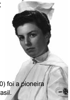
Anna Nery (1814-1880) foi a pioneira da enfermagem no Brasil.

9. Leia o texto adiante, adaptado do portal eletrônico da Escola de Enfermagem Anna Nery, da UFRJ, e responda a questão proposta: