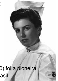
Anna Nery (1814-1880) foi a pioneira da enfermagem no Brasil.

A Escola de Enfermagem Anna Nery/EEAN da Universidade Federal do Rio de Janeiro/UFRJ, primeira Escola de Enfermagem no Brasil, surgiu no contexto do movimento sanitarista brasileiro do início do século XX. Em 90 anos de existência a instituição registra um papel histórico-social de vanguarda, na expansão e desenvolvimento da enfermagem em nosso País. Destacam-se nesse percurso, entre outras realizações, a criação da Associação Brasileira de Enfermeiras Diplomadas (1926), atualmente Associação Brasileira de Enfermagem – ABEn; a criação de novas escolas de enfermagem; a organização de hospitais e centros de saúde, formação e qualificação de enfermeiros Especialistas, Mestres, Doutores e em Programas de Pós-Doutorado, principalmente, em todas as regiões do país e na perspectiva de Cooperação Técnica e Científico-Cultural com alguns países da América Latina (Argentina, Colômbia, México, Peru) e da África (Angola e Moçambique).